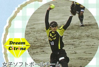
女子ソフトボールチーム 『Dream Citrine (ドリームシトリン)』