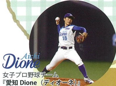
女子プロ野球チーム 『愛知 Dione (ディオネ)』