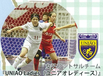
女子フットサルチーム 『UNIAO Ladies (ユニアオレディーズ)』